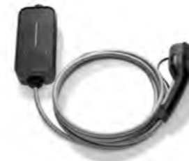
SERIENMÄSSIG: FLEXIBLE FAST CHARGER.