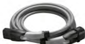
SERIENMÄSSIG: BMW CHARGING CARD 3 UND LADEKABEL (MODE 3).

Sie wollen auch auf Reisen Ihren Elektroantrieb bestmöglich nutzen? Kein Problem. Mit der im Lieferumfang Ihres BMW Plug-in-Hybrids bereits enthaltenen BMW Charging Card 3 haben Sie Zugriff auf ein ständig wachsendes Netz an öffentlichen Ladestationen verschiedener Betreiber. Ladepunkte in Ihrer Nähe finden Sie immer ganz einfach über BMW Maps in Ihrem Fahrzeug oder die My BMW App 1 . Dort sehen Sie auch auf einen Blick, welche Ladestationen verfügbar sind. Für das unkomplizierte AC-Laden unterwegs wird das Ladekabel (Mode 3) für Ihren Plug-in-Hybrid gleich mitgeliefert. Mit Ihrer BMW Charging Card 3 sind Sie zudem jederzeit für einen Ladestopp gerüstet. Übrigens: Als BMW Fahrer erhalten Sie exklusive und attraktive Konditionen im BMW Charging Netzwerk. Weitere Informationen dazu finden Sie auf bmw-charging.com .