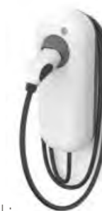
OPTIONAL: SMART PARTNER WALLBOX 2 .