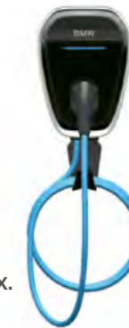
OPTIONAL: BMW WALLBOX.