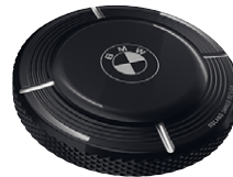
9 Tankdeckel abschließbar