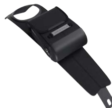
3 Tanktasche schwarz klein