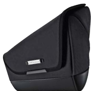
4 Rahmentasche schwarz rechts