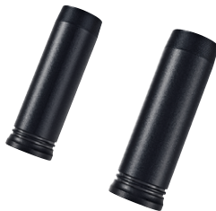
18 Abdeckung Gabelholm