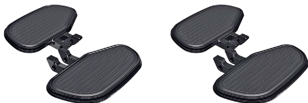
15 Fahrertrittbretter Machined / 2-Tone Black