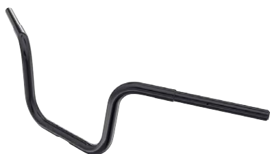
13 Lenker Apehanger 6,5" schwarz