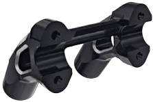
5 Lenkererhöhung 4", Machined