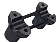
8 Lenkererhöhung 1,5", 2-Tone Black