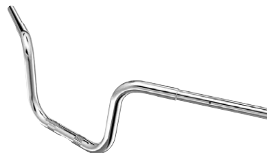
12 Lenker Apehanger 6,5" verchromt