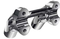
4 Lenkererhöhung 4", verchromt