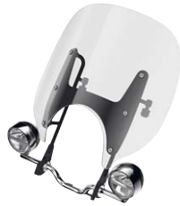
2 Windschild klar, mittelhoch