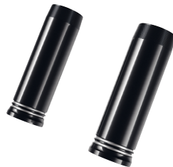
8 Abdeckung Gabelholm