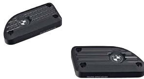
15 Deckel Ausgleichsbehälter vorn