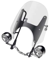
1 Windschild klar, niedrig