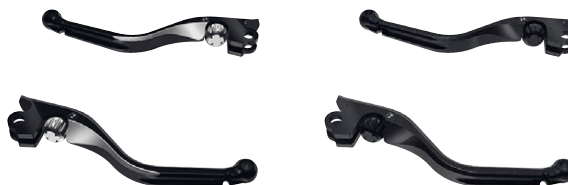
14 Handhebel einstellbar Machined / 2-Tone Black