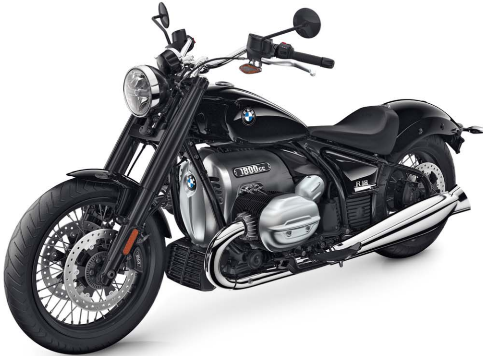
BMW R 18 Fahrzeugpreis