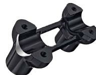
7 Lenkererhöhung 1,5", Machined