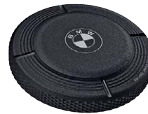
19 Tankdeckel abschließbar