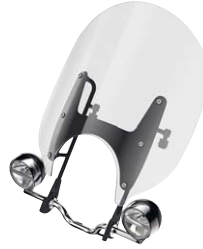
3 Windschild klar