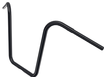
11 Lenker Apehanger 16" schwarz