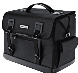
5 Hecktasche schwarz