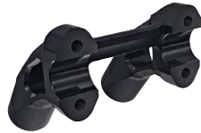
6 Lenkererhöhung 4", 2-Tone Black