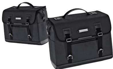
1 Seitentaschen schwarz