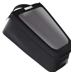
2 Tankrucksack schwarz