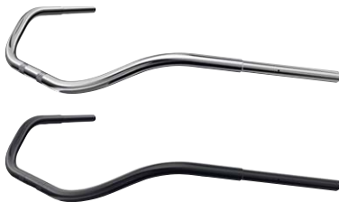
9 Lenker Beachbar 36/7" verchromt / schwarz