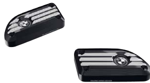
5 Deckel Ausgleichsbehälter vorn