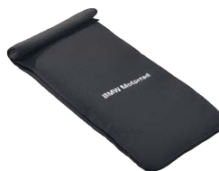
6 Tasche für Smartphone